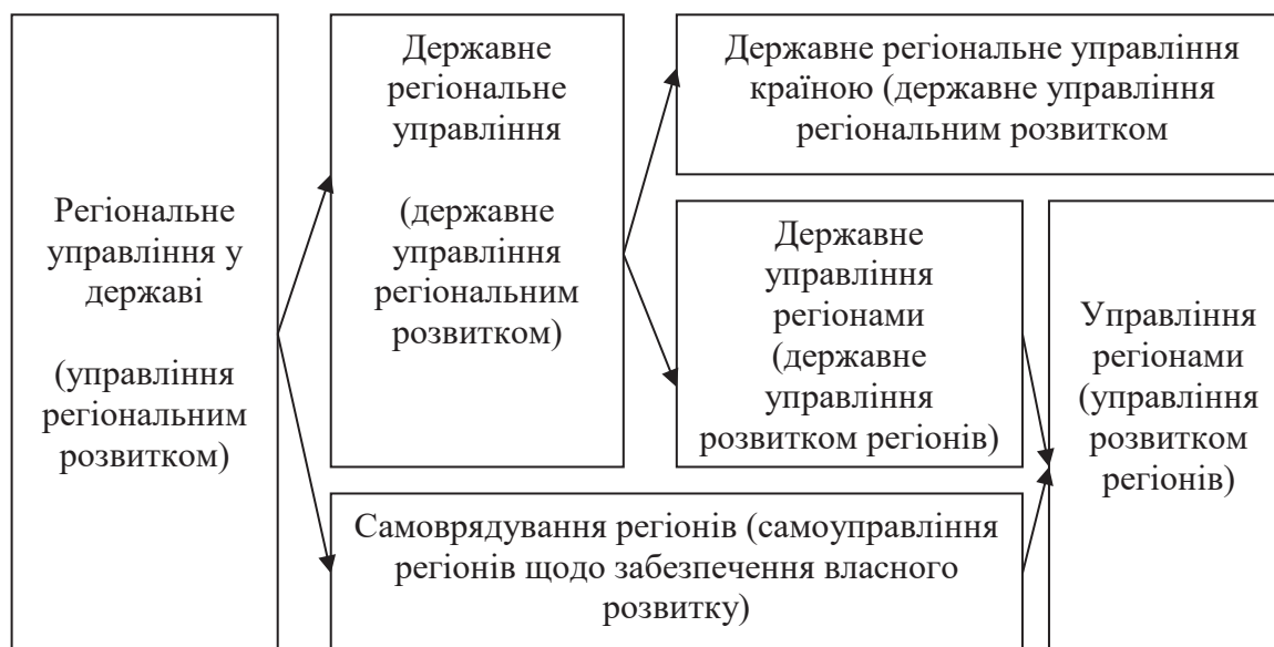
Рис. 1. Взаємозв'язок складових державного регіонального управління

та інших стандартів для кожного громадянина незалежно від місця проживання [7-8].